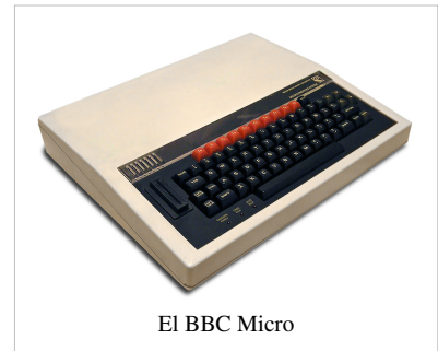
El BBC Micro

La BBC se interesó en hacer una serie en alfabetismo en computadores, y envió una propuesta para que un pequeño computador estandarizado fuera usado con el show. Después de examinar varios participantes, seleccionaron lo que era conocido entonces como el Acorn Proton e hicieron un número de cambios menores para producir el BBC Micro. El Micro era relativamente costoso, lo que limitó su atractivo comercial, pero con un mercadeo extenso, el soporte de la BBC y la gran variedad de programas, eventualmente se vendieron como 1,5 millones de unidades del sistema. Acorn fue rescatada de la oscuridad, y se fue a desarrollar el procesador del ARM (Acorn RISC Machine) para accionar los siguientes diseños. El ARM es ampliamente usado hasta el día de hoy, accionando una amplia variedad de productos como el iPhone.